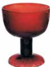
Heikki Orvola, Miranda för lilla glasbruk.