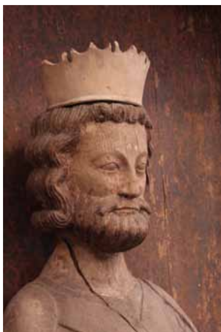
Kung Olav den helige från Norge.

Att få fira gudstjänst i en 700 år gammal kyrka betyder att historien är närvarande. Vi kan konkret uppleva hur kyrkorummet förenar oss med gångna generationer. Ja, tiden upplevs stå stilla. Vi upplever något av evigheten. ■