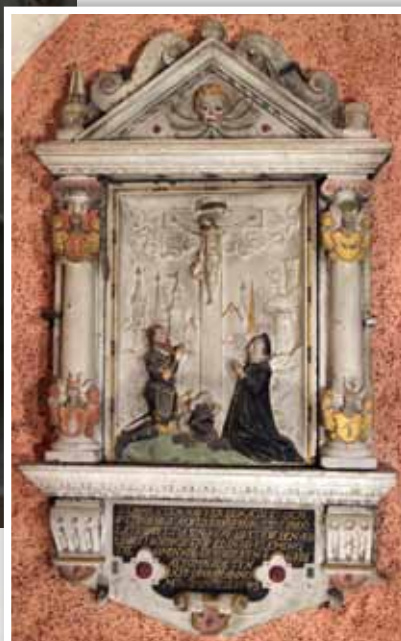
Epitafium Stålmarm, 1603.