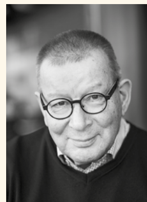
Eero Huovinen, emeritus-biskop i Helsingfors stift