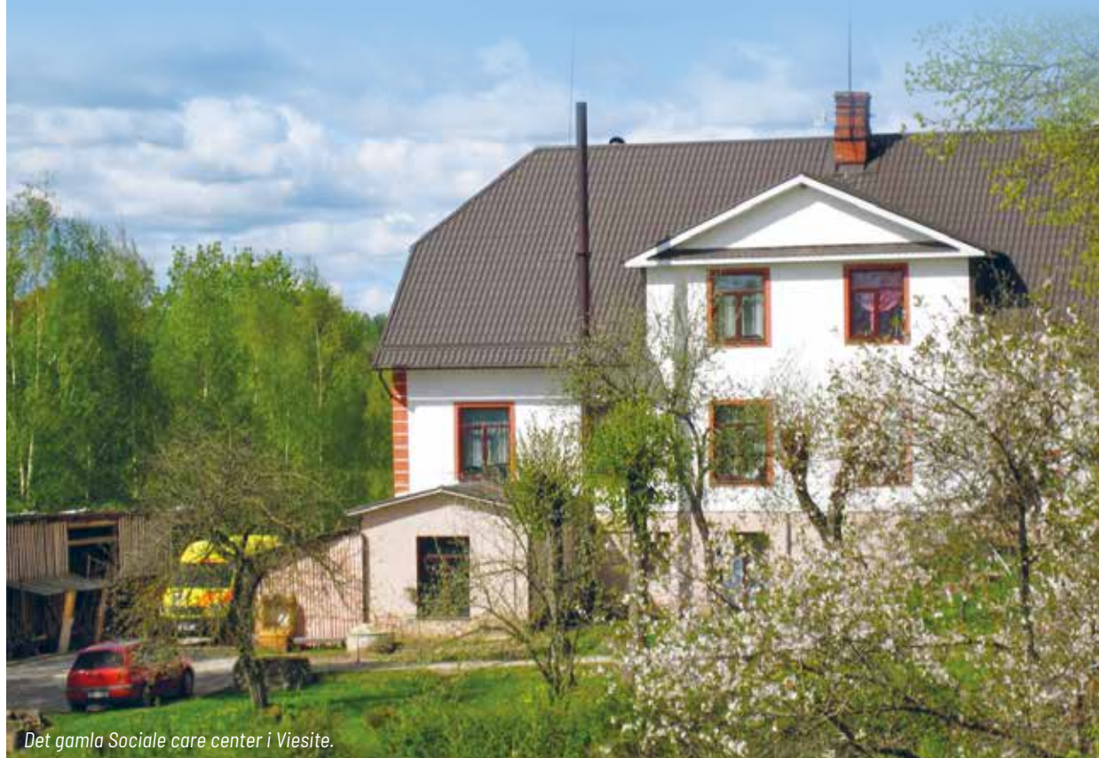
Det gamla Sociale care center i Viesite.