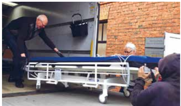
En "sjukhussäng" till en man som vårdas i sitt eget hem.