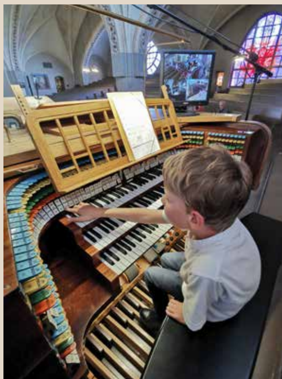
... och i Tammerfors domkyrka.